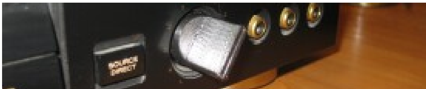
Операция "Пластиковая рука"