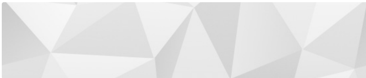
Создание культуры труда в маленькой мастерской с применением 3д печати создание подставки под инструмент