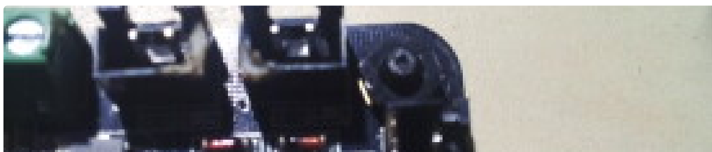
Ремонт платы lerdge x