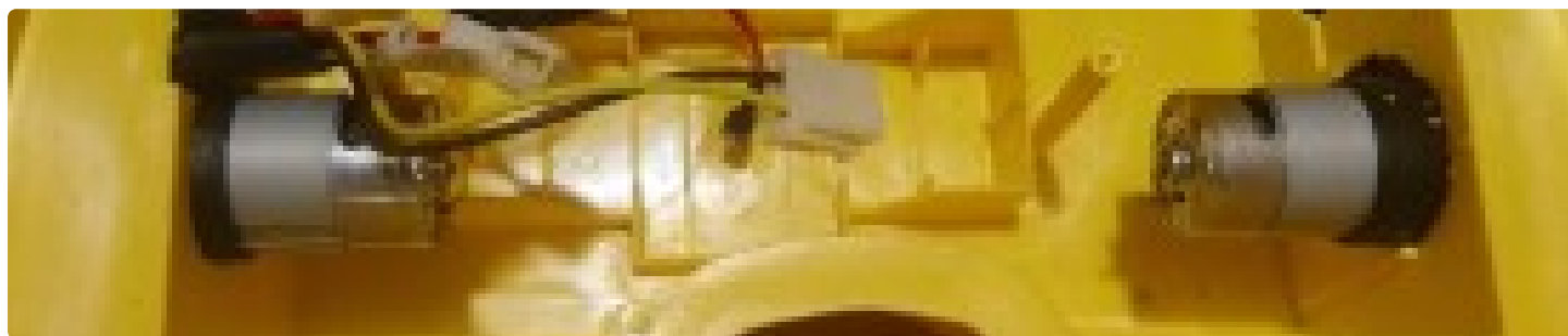
Доработка детской машинки